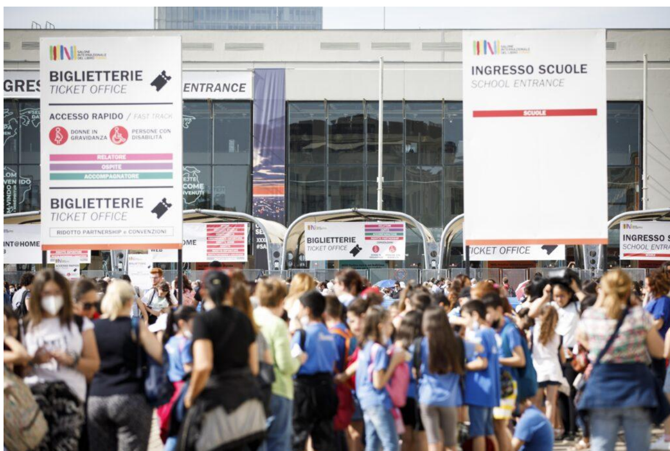
Torino, Lingotto 19 05 22 Salone del Libro di Torino

«Ma che bello rivederti!» Già rivedersi... dimenticando che spesso al SalTo ci si è incontrati in presenza per la prima volta e nessuno conosceva dell'altro niente di più di quello che appare dalle foto pubblicate sui social.