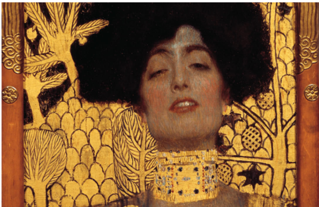
Gustav Klimt, Giuditta I

Gustav Klimt abita il nostro immaginario. Anche chi non è particolarmente esperto d’arte, al solo nome dell’artista sa evocare in sé immediatamente l’oro, la bidimensionalità, la passione, il talento, tutti elementi che lo contraddistinguono fortemente.