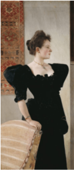
Gustav Klimt, Ritratto di signora

Accoglie completamente l'idea della Gesamtkunstwerk, l'opera d'arte totale, concetto wagneriano che vede l'arte esprimersi in ogni forma, senza disdegnare nulla, dalle architetture alle scenografie, dagli oggetti ai mobili, dal vasellame ai gioielli.