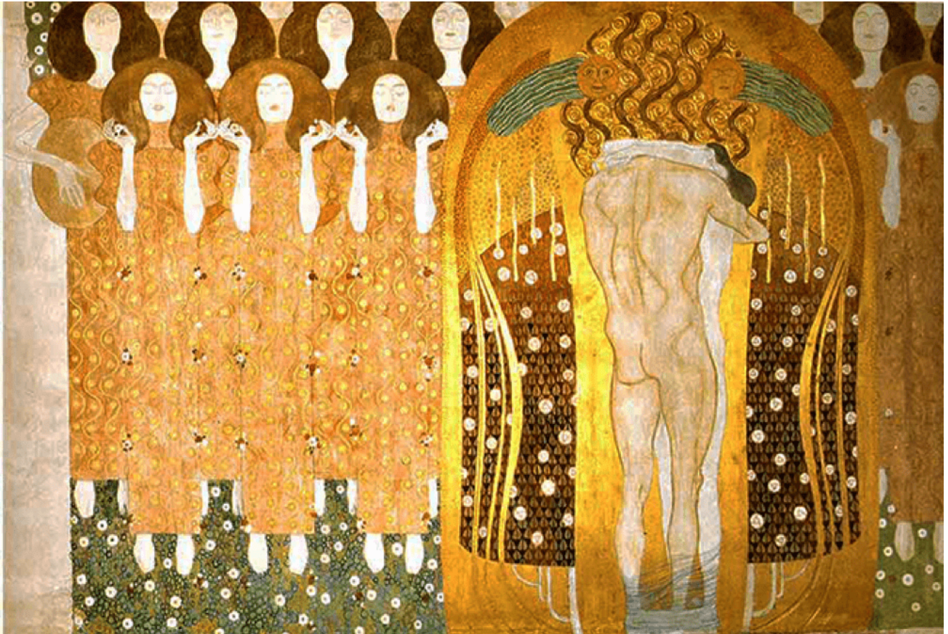
Gustav Klimt, Il fregio di Beethoven (particolare) foto da skandorinasdiary.com

Grazie alla Mostra "Klimt. La Secessione e l'Italia", in corso a Roma fino a fine marzo 2022, possiamo sperimentare di persona la complessità e la ricchezza di questa fase artistica viennese, che ebbe forti influenze anche nel mondo artistico italiano.