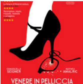
Venere in pelliccia locandina