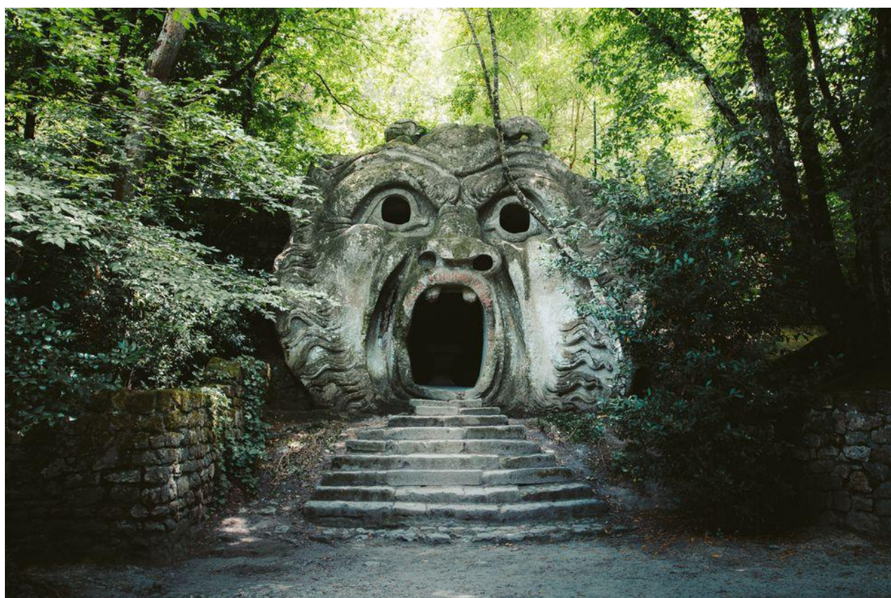
Proteo Orco Bomarzo