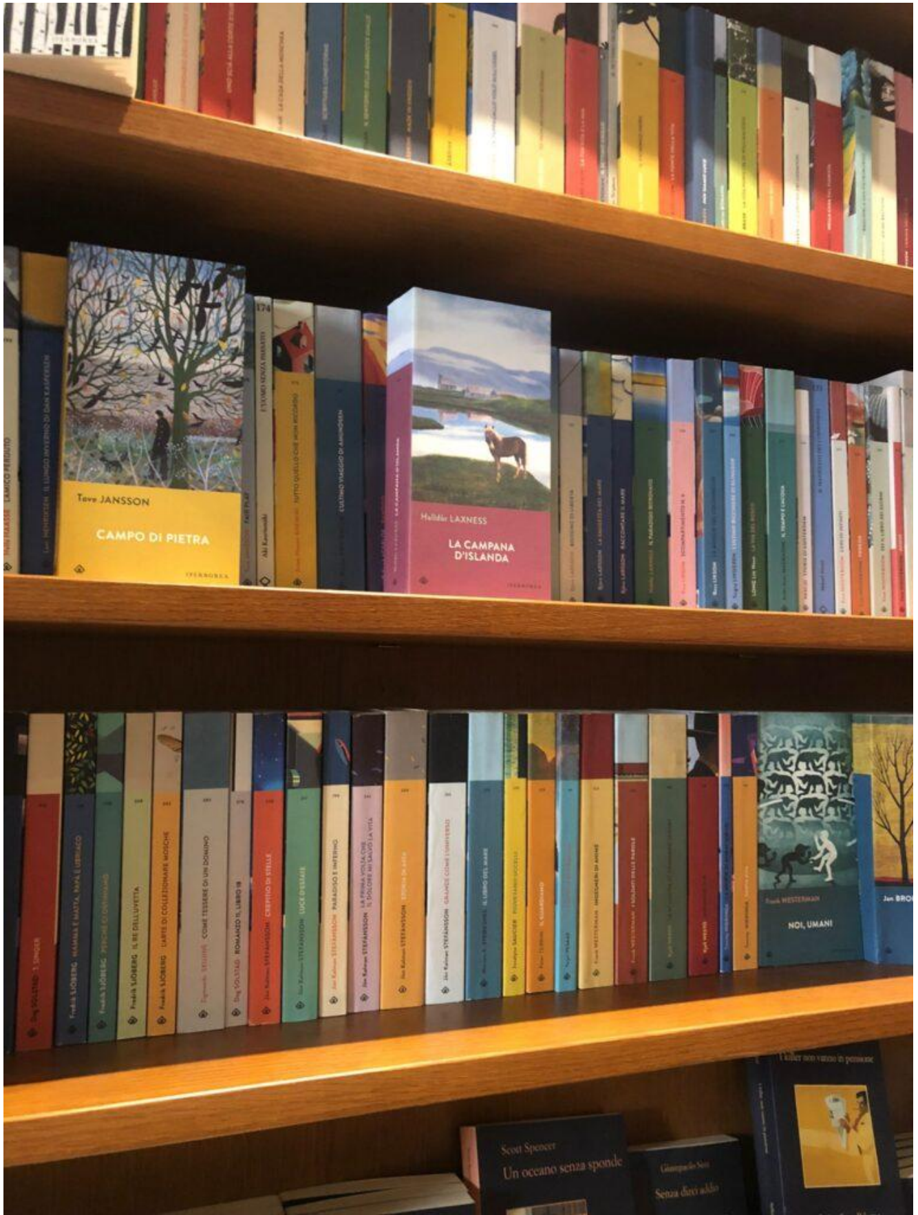
Una sezione dedicata ai libri di Iperborea