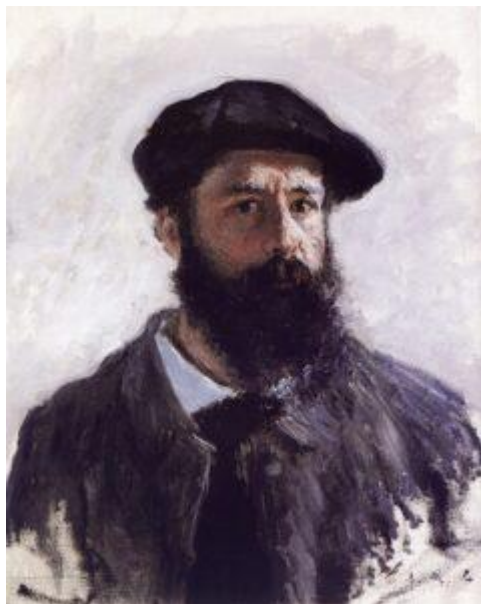
La Vita di Monet

Nato il 14 novembre 1840 a Parigi, Oscar-Claude Monet trascorse la sua infanzia a Le Havre, una città portuale nella regione della Normandia. Il suo talento artistico si manifestò fin da giovane, quando divenne noto per i suoi ritratti a carboncino dei cittadini locali. Dopo aver studiato all'École des Beaux-Arts a Parigi, Monet divenne un pittore en plein air, che preferiva dipingere all'aperto piuttosto che in uno studio d'arte tradizionale.