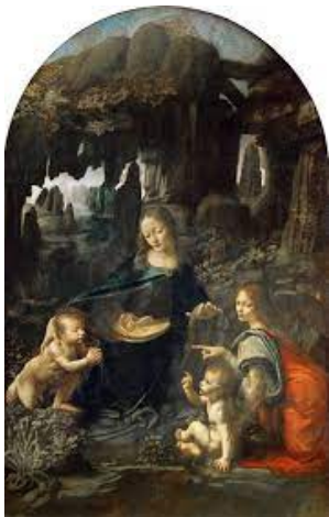
La Vergine delle Rocce

Questo quadro divenne famosissimo nel 1911: infatti fu il primo quadro ad essere rubato da un museo! Fu ritrovata due anni dopo, quando il ladro andò a Firenze per rivenderla.