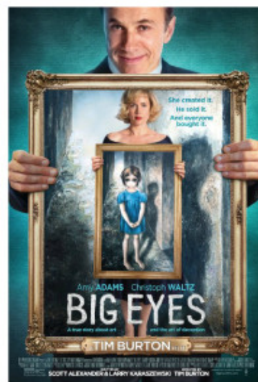
Locandina del film

conosce il mezzo, ha l'arte del racconto e nessuno dei 114 minuti del film ha il marchio della banalità.