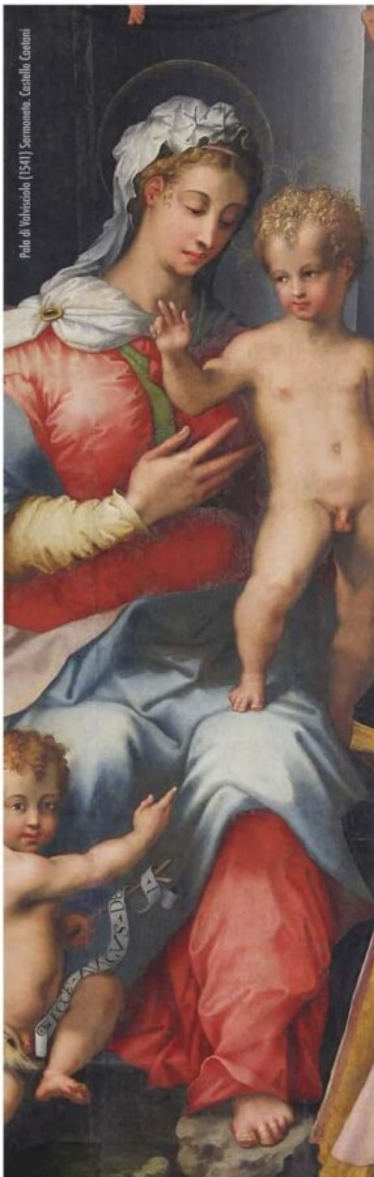
Pala di Valvaciolo (1541) Sermoneta. Castello Caetani