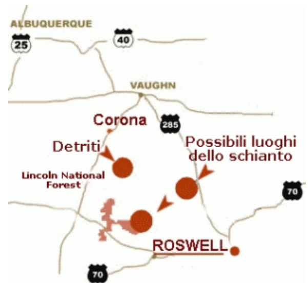
Possibili luoghi dello schianto

Nel classico della cinematografia "Guerra dei mondi" un disco volante precipita in una zona di campagna isolata. I militari accorrono sul luogo dell'incidente per effettuare ricerche. Tutto questo potrebbe accadere anche nella vita reale? Secondo alcuni è già accaduto a Roswell (Nuovo Messico, Stati Uniti) l'8 Luglio 1947. L'incidente di Roswell è unico nella storia degli UFO ( Unidentified Flying Object o Unknown Flying Object ) perchè è l'unica volta che i militari hanno comunicato di aver tra le mani un disco volante precipitato. Nel 1947, infatti, un comando americano divulgò un comunicato stampa in cui confermava il recupero di un UFO. La notizia dell'incidente si diffuse in tutto il mondo, ma il giorno dopo gli stessi sottoscrissero che in realtà si trattava di un pallone sonda appartenente ad un'operazione della United States Air Force . Tuttavia molti dichiararono che quest'ultima affermazione era una menzogna. Secondo alcuni testimoni,