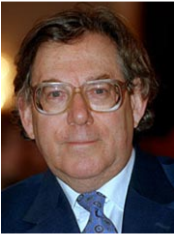
Paul Jozef Crutzen

“Antropocene” (dal greco anthropos , uomo) è un neologismo coniato nel 2002 dal chimico olandese Paul J. Crutzen – Premio Nobel per la chimica (1995) – per definire una nuova era geologica. Quest’ultima, secondo lo scienziato, si distinguerebbe da quella attuale (Olocene) per l’impatto indelebile dell’uomo sul clima e sull’ambiente.